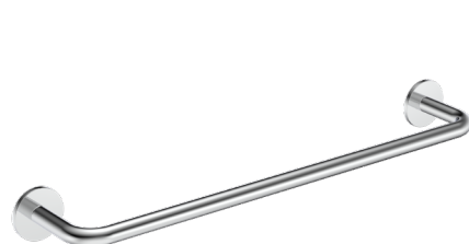
E305005 Porta Asciugamano L450mm Towel Holder L450mm