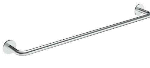
E305006 Porta Asciugamano L600mm Towel Holder L600mm